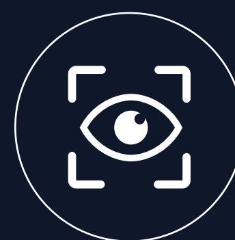
700cd/m 2 显示