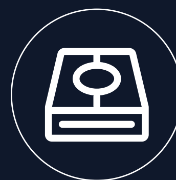
支持扩展固态硬盘